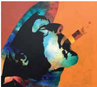
Forside foto Værk af Michael Grønlund