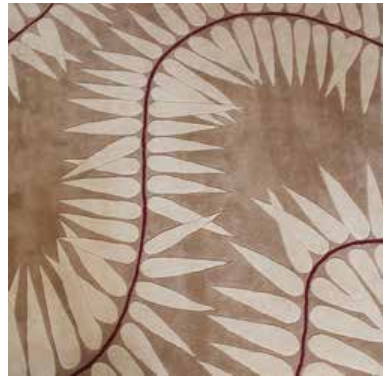
Naja Utzon Popov