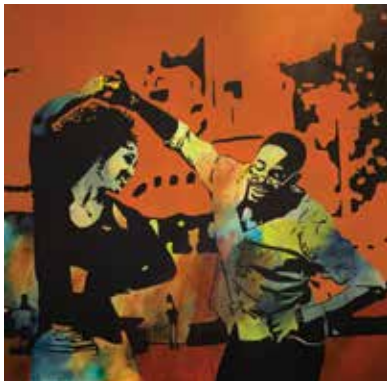
Forside foto Værk af Michael Grønlund