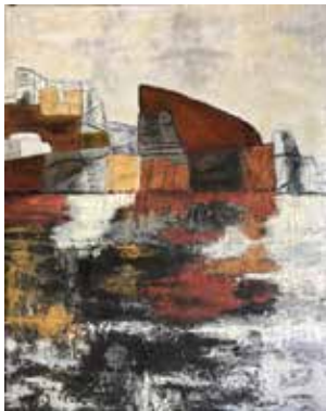
Forside foto Udsnit af værket "By" af Minna Kirstine Pedersen